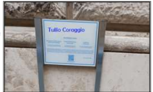
In alto il pezzo di artiglieria che caratterizza il monumento ai caduti a Sora. L'altra foto rappresenta il progetto per ricordare l'Eroe sorano e Socio Fondatore dell'ADMI