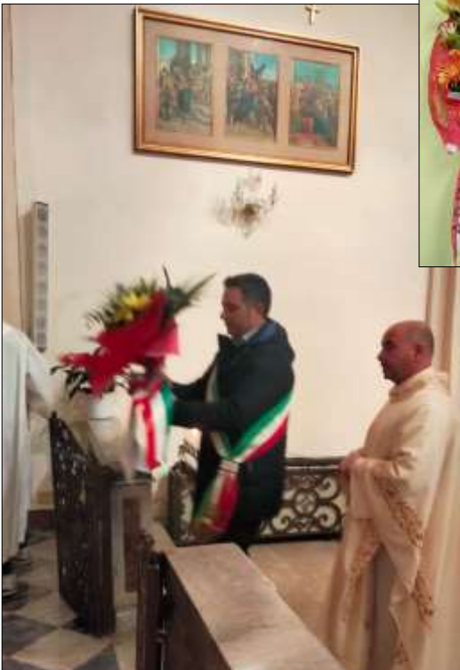
Il Sindaco della Città di depone un mazzo di fiori donati da ADAMI sull'altare della chiesa